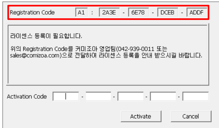
Figure 1. License Activate #1

커미조아 영업팀 : Tel) 042-939-0011 / E-mail) sales@comizoa.com